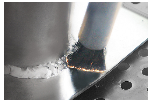
Miljontals små elektriska laddningar tar bort missfärgade färger, oxidationslager och till och med mindre skalning.