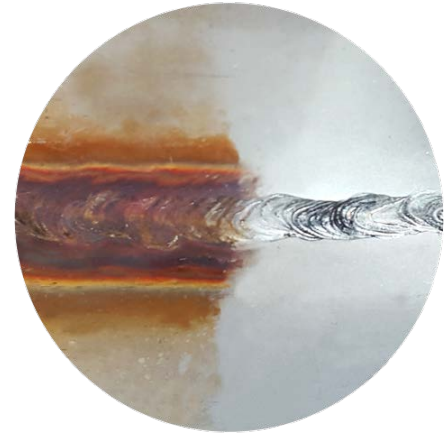
Svetssöm före/efter rengöring

Alla metoder har en stor gemensam nackdel: Ytorna måste passiveras i ett ytterligare arbetsmoment. Detta kan göras antingen genom lagring under kontrollerade luftfuktighet och syretillförsel förhållanden, eller med hjälp av ett passiveringsmedel som återigen kommer att påverka hälsa och miljö.