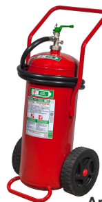
Art.nr: 19508-15 Klass AB och lithium 50 L