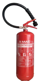
Art.nr: 22066-25 Klass ABF och lithium 6 L